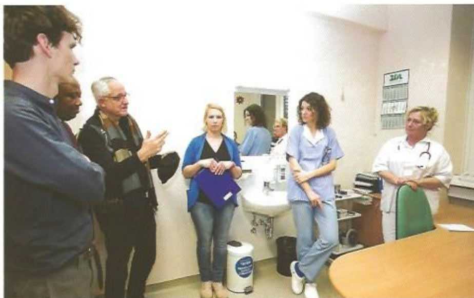
Obisk v ambulanti družinske medicine.