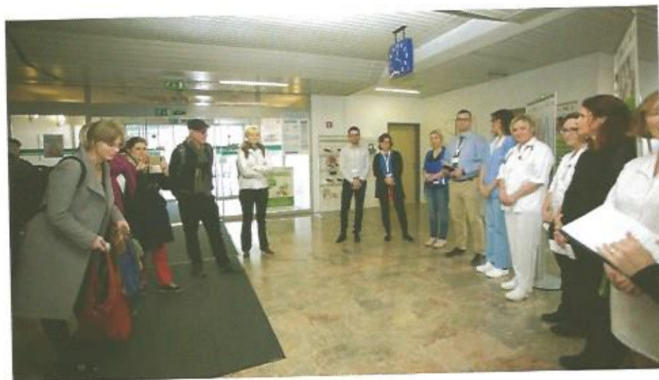
Pozdrav gostov pred ogledom ZD Ljubljana.

Zdravstveni dom Ljubljana predstavlja v tem konzorciju izkušeno raziskovalno ustanovo, ki je v veliki meri uspela razširiti obseg oskrbe kroničnih bolnikov in lahko postavi temelje za analizo stanja v vseh vključenih državah. Ob tem je edina organizacija v projektu za ambulantami