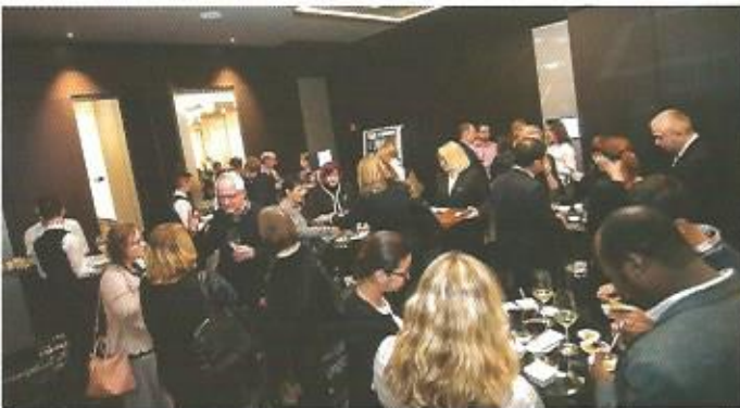
Živahna izmenjava mnenj se je nadaljevala tudi po koncu otvoritve.

smatrajo za zelo razvite in v nekaterih pogledih tudi najnaprednejše države. Zavedamo pa se, da nas čaka še dolga pot, kjer ovire niso le strokovne narave. Prepričani smo, da bomo čez slaba štiri leta, ko bomo projekt zaključili, bistveno boljše razumeli svoj sistem in razumeli tudi to, kako ga lahko izboljšamo.