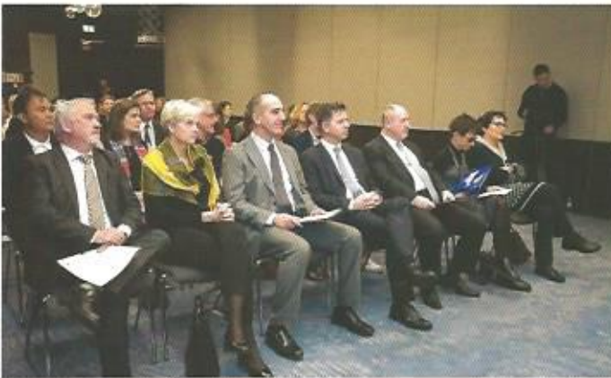
Visoki gostje na predstavitvi projekta SCUBY.