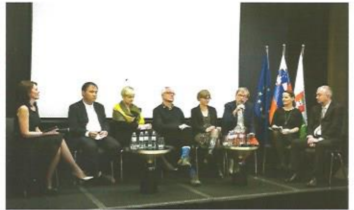
Panel vseh predstavnikov projekta in vključenih deležnikov.